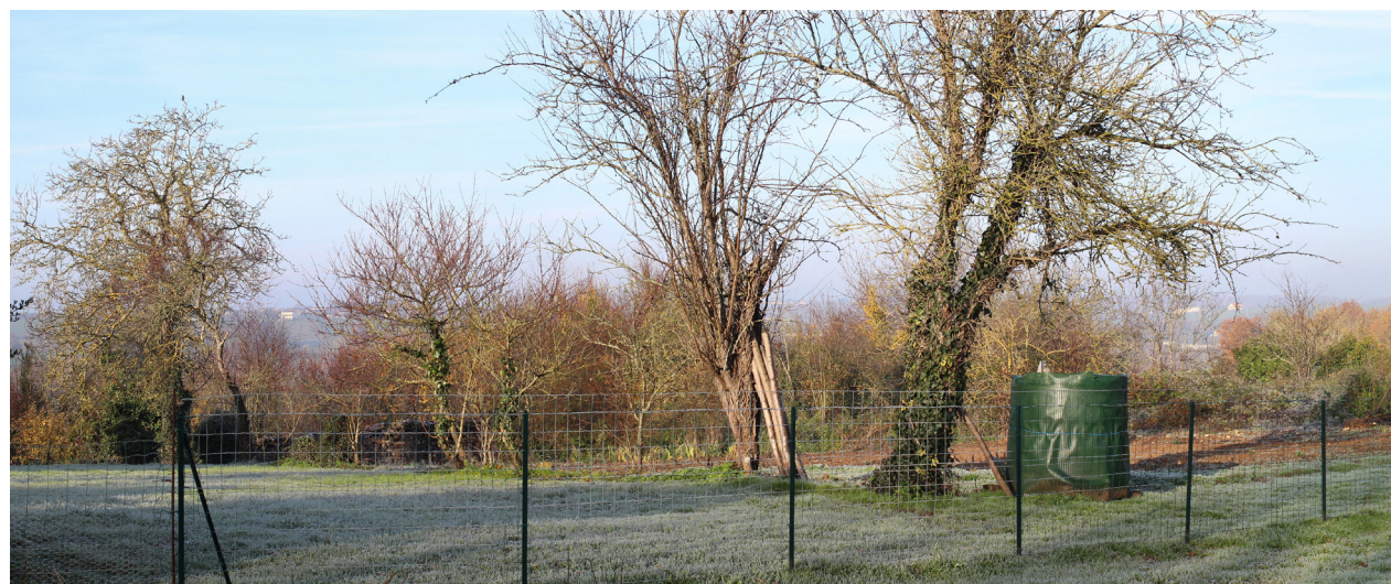
Photographie de l'état initial à 50°